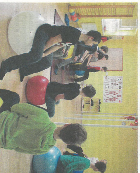
CVIČEBNA. Špičkově vybavenou velkou cvičebnu dáčické nemocnice si měly možnost vyzkoušet i děti.

našeho zařízení z lůžek akutní péče, kde byli operováni na dolěčení a rehabilitaci po operaci. Je užasně pozorovat rychlost nápravy chůze a radost pacientů ze zvyšování jejich soběstačnosti a dovednosti v pohybu