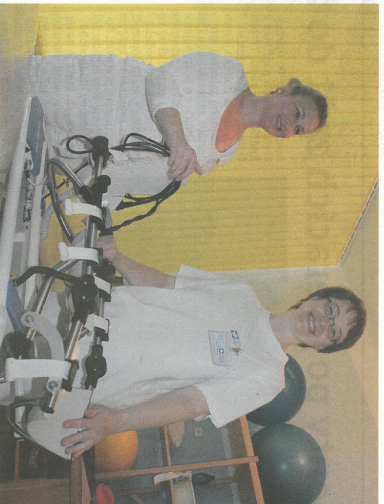
MOTODLANA. Kvalifikovanému odbornému personálu pomáhají v dáčické nemocnici ty nejmodernější přístroje. Patří k nim také motodlahy, jež umožňují pasivní cvičení pacientů po operacích například kolenních kloubů.

Všechny procedury vykazované zdravotním pojištěním jsou na doporučení našeho rehabilitačního lékaře nebo ambulancních specialistů ortopedů či neurologů. Ve 2. patře budovy ve velké cvičebně mohou